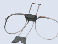
3M™ 6878 Kit acoplamiento gafas para máscaras completas Serie 6000