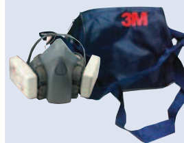
3M™ 106 Bolsa para media máscara