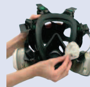
3M™ 105 Toallita limpiadora facial