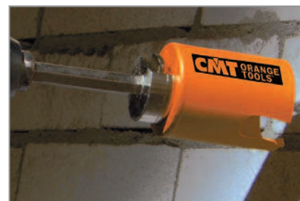
Ladrillos de cal