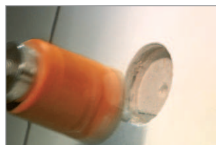
Azulejos de cerámica