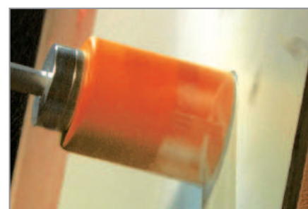
Trespa® y plástico