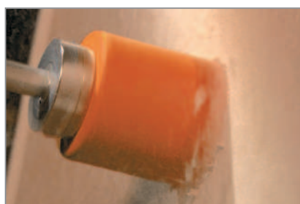
Madera y MDF