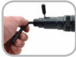
EMBRAGUE DESLIZANTE CON REGULACIÓN EXTERIOR