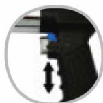
INVERSOR MEDIANTE MANDO