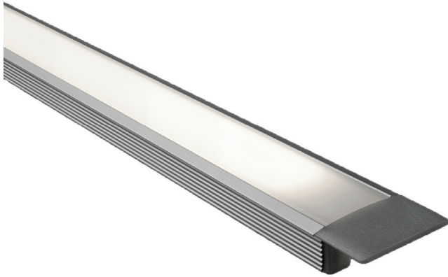
Iluminación super intensa 180 LED/metro