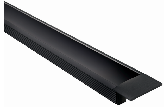
Iluminación super intensa 180 LED/metro