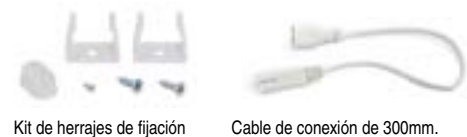
Kit de herrajes de fijación