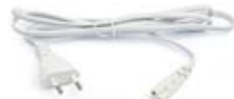
Cable de alimentación de 1.500mm.

Lámpara de luz LED realizada en material termoplástico, completa con interruptor unipolar, cable de alimentación de 1.500mm., cable de conexión de 300mm. y kits con herrajes de fijación.