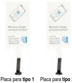
Placa para tipo 1 Placa para tipo 2