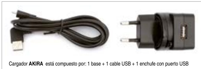
Cargador AKIRA está compuesto por: 1 base + 1 cable USB + 1 enchufe con puerto USB

Importante. Para completar el producto se debe pedir un código de cargador wireless y un código de la pegatina cargadora.