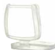
Retenedor de filtro D701

La media máscara de la serie HF-800 y sus correspondientes filtros cuentan con una resistencia a la inhalación de menos de 5 mbar, medida a 95 l/min continuamente.