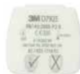
D7925 P2 R