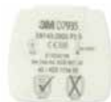
D7935 P3 R