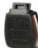
D8095 A2 P3 R