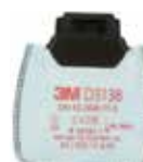
D3138 P3 R/ Vapores orgánicos y gases ácidos molestos