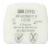
D7915 P1 R