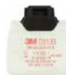
D3135 P3 R