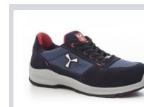
S0300 AZUL MARINO/MA RÍTIMO