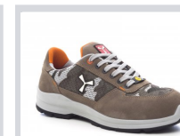
S0200 CAQUI/MIMÉTICO GRIS