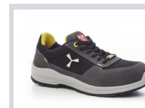
S0104 GRIS ACERO/NEGRO