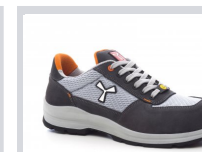
S1003 GRIS ACERO/GRIS CLARO