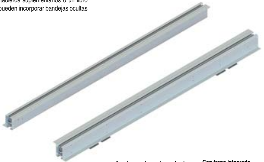
Apertura y cierre sincronizado