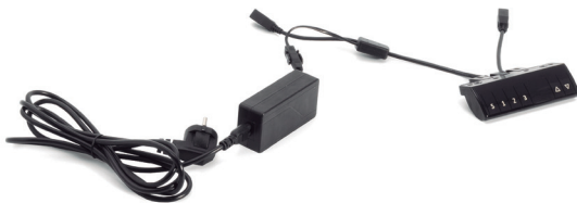
Botonera de mando