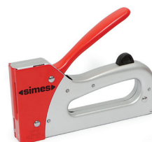
GRAPADORA MANUAL MODELO simMT80 SP EMPLEA GRAPA 80 DE 6 HASTA 12mm. CÓDIGO: 1247.2