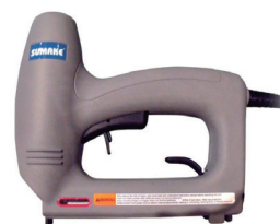
GRAPADORA ELÉCTRICA DUAL MODELO E80/166K EMPLEA GRAPA 80 DE 6 HASTA 16mm. NEUMÁTICA, PRESIÓN: 5 a 7 ATM. CÓDIGO: 1194.6