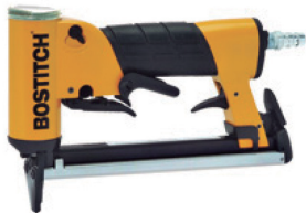
GRAPADORA GAMA ALTA MODELO 21680B-E EMPLEA GRAPA 80 DE 6 A 16mm. NEUMÁTICA, PRESIÓN: 4,90 a 8,40 ATM. CÓDIGO: 1247.320

* También disponibles con marca ALK. Serie €ko GRANDES CONSUMOS. Ver página siguiente.