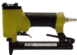
GRAPADORA GAMA ECONÓMICA MODELO ECO EMPLEA GRAPA 80 DE 7,5mm. NEUMÁTICA, PRESIÓN: 4 a 7 ATM. CÓDIGO: 372.38