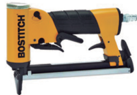
GRAPADORA GAMA ALTA AUTOMÁTICA EMPLEA GRAPA 80 DE 4 A 16mm. NEUMÁTICA, PRESIÓN: 5 a 7 ATM. CÓDIGO: 1247.284