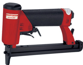
GRAPADORA GAMA MEDIA MODELO SIMG80 EMPLEA GRAPA 80 DE 4 A 16mm. NEUMÁTICA, PRESIÓN: 4 a 7 ATM. CÓDIGO: 1247.1